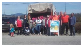
Gemeinde St. Peter