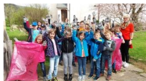
VS Bad Gams