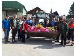
Gemeinde St. Martin

Ein großer Danke gilt den Schulen und Kindergärten, die tatkräftig mit anpackten und Schulhof, Straßenränder und Parkanlagen von Abfall befreiten. Bestens vorbereitet durch einen Waste-Watcher-Workshop mit unseren AbfallberaterInnen und gut ausgestattet mit Handschuhen nahmen schon die Kleinsten an dieser Aktion teil.