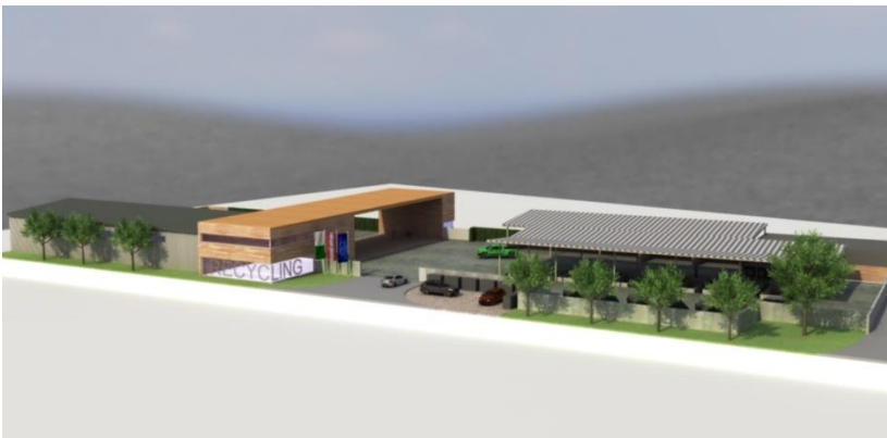
So könnte ein Ressourcenpark in Zukunft in Deutschlandsberg aussehen.