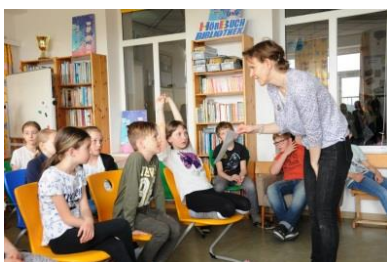
„Waste Watcher“ Workshop mit anschließender Flurreinigung in der VS Bad Gams